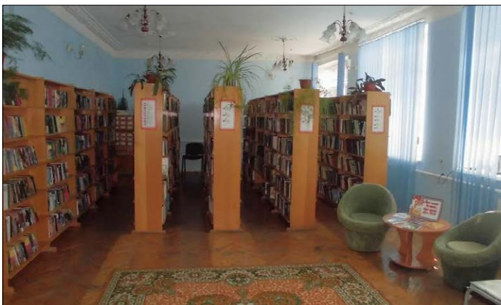
Абонемент. 2015 р.