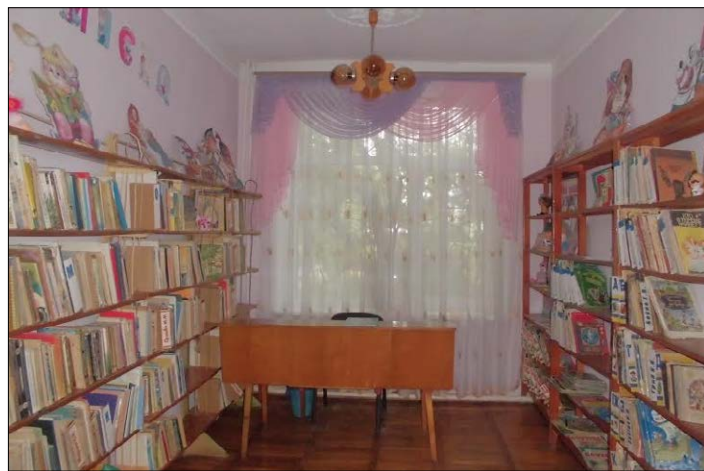
Відділ обслуговування дошкільнят та учнів 1–4 кл. 2015 р.