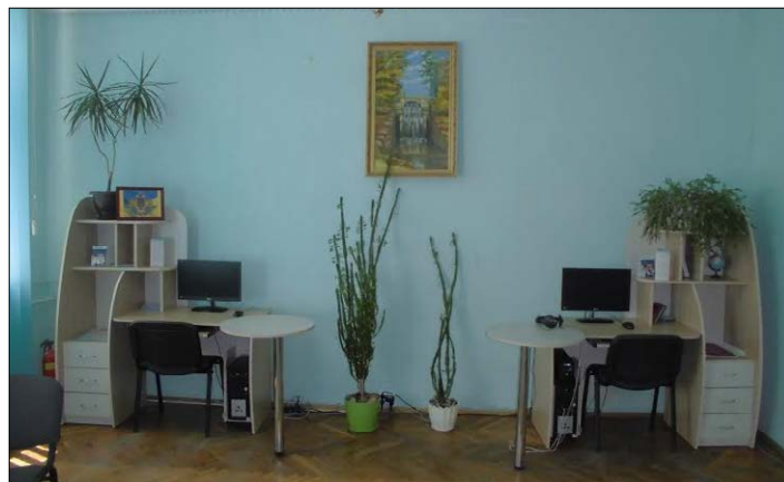
Відділ інформаційних технологій та бібліотечного обслуговування користувачів. 2015 р.