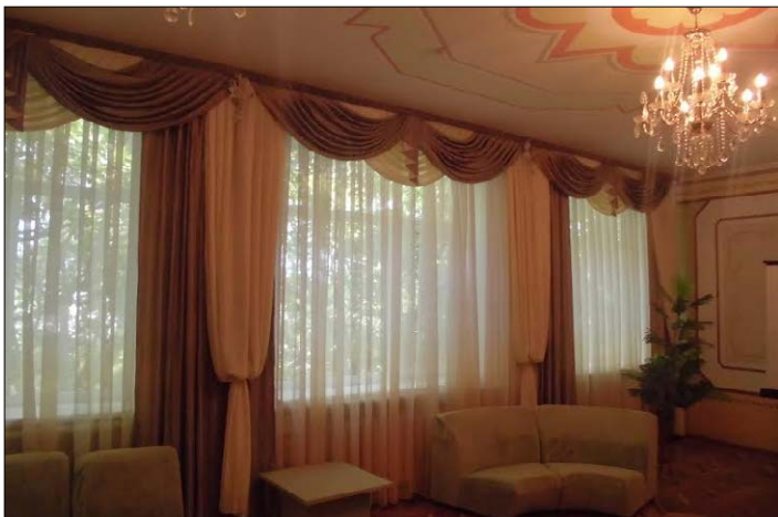
Літературно-музична вітальня. 2015 р.