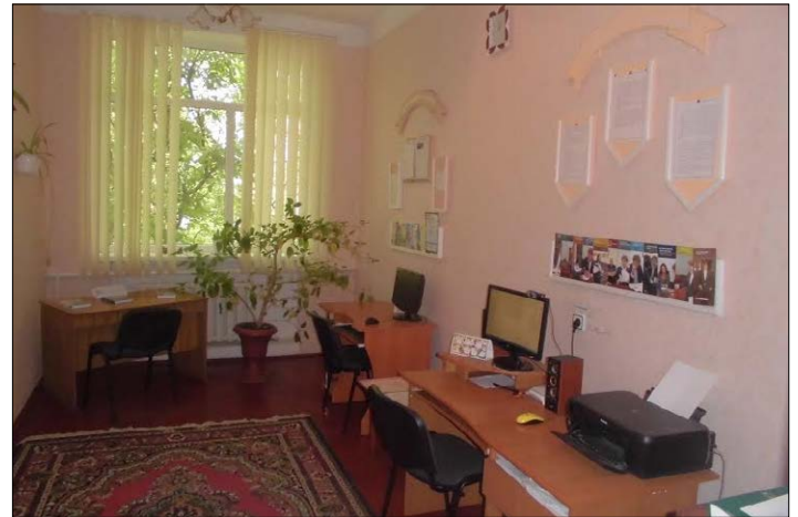
Дистанційний консультаційний центр. 2015 р.